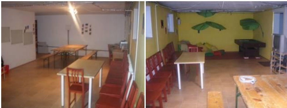
Raum für "Krefa TV Baumgarten"

Um Zusammenhänge der Projekte in der Region sichtbar zu machen und die öffentliche Aufmerksamkeit zu stärken, wäre eine Power Point Präsentation wichtig. Wer also das Programm beherrscht und helfen will, schreibt bitte an info@kreativfabrik.at