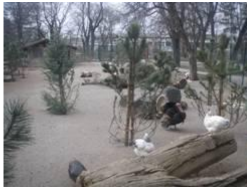
Tiergehege Wr. Neustadt Stadtpark